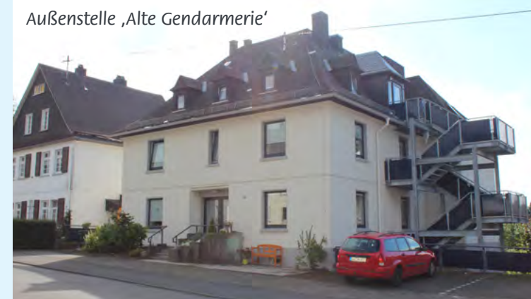
Außenstelle ‚Alte Gendarmerie‘

9 Plätze in einer Hausgemeinschaft / 4 ambulant betreute Wohnungen