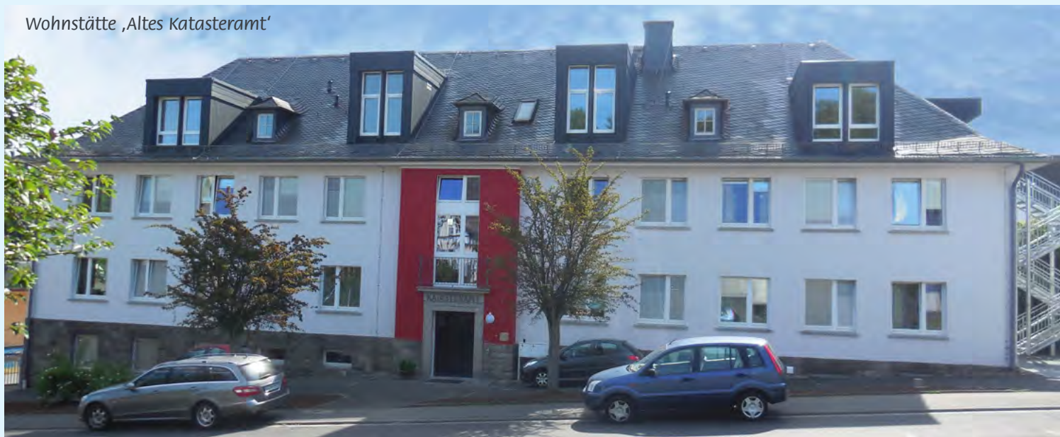
Wohnstätte ‚Altes Katasteramt‘

Beide Häuser sind barrierefrei und verfügen über große helle Gemeinschaftsräume. Die jeweiligen Apartments sind ein Baustein des ambulanten Wohnens in der GFB und bieten ein Höchstmaß an selbstständiger Lebensführung.